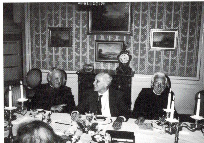
Prophete rechts, Prophete links: Ehemalige Präfecten umrahmen den Gastgeber.

Wollte man den Inhalt der Gespräche wiedergeben, könnte man ihn so zusammenfassen, wie es Bundespräsident Flavio Cotti in seiner Ansprache anlässlich der Eröffnungsfeier zum 700-Jahr-Jubiläum der Eidgenossenschaft formulierte: «In diesem Jahr gedenken wir nicht nur eines einzelnen Ereignisses, sondern vielmehr einer ganzen Entwicklung, einer langen Geschichte, mit Daten, die oft wichtiger sind als 1291. Eine Geschichte, die von Menschen geprägt worden ist, die vielleicht Wesentlicheres geleistet haben als die von der Legende überhöhten Protagonisten der Gründungszeit. Wir sehen den langen Weg eines einfachen, zähen und treuen Volkes, eines Volkes, das aber auch egoistisch, intolerant und streitbar sein konnte. Wir sehen eine lange Folge nobler Gesten, eine Folge aber auch von Fehlern und Schwä-